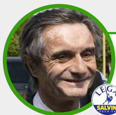
ATTILIO FONTANA (Lega Nord) Presidente Regione Lombardia