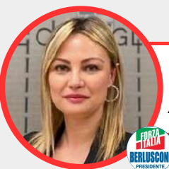
SIMONA TIRONI (Forza Italia) Assessore all'Istruzione, Formazione e Lavoro